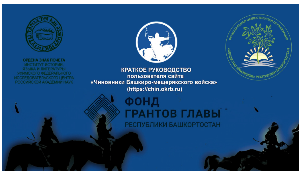
Рис. 5. Кадр из обучающего ролика

Неотъемлемой частью любого веб-проекта является «Руководство пользователя сайта». З.Я. Рахматуллиной, С.И. Хамидуллиным, А.Я. Ильясовой, Р.С. Таймасовым, А.А. Гибадуллиным и Р.М. Аглиуллиным был создан обучающий ролик «Краткое руководство пользователя сайта «Чиновники Башкиро-мещерякского войска» ( https://chin.okrb.ru )» ( http://rihll.com/files/video/2024/КРАТКОЕ%20РУКОВОДСТВО-_1.mp4 , рис. 5).