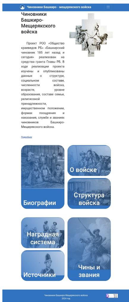
Рис. 2. Главная страница сайта

Сайт представляет собой уникальную базу данных о периоде кантонной системы управления Башкирией: Башкиро-мещерякском войске, его структуре, наградной системе, чинах и званиях (рис. 2). Основной объем информации составляют биографические сведения о башкирских чиновниках упомянутого войска (кантонных начальниках, юртовых старшинах, урядниках, хорунжиях, сотниках, есаулах, писарях, фельдшерах и др.). Учитывая, что в XIX в. все мужское население состояло на военной службе, в материалах сайта многие представители народа могут отыскать своего предка или дальнего родственника.