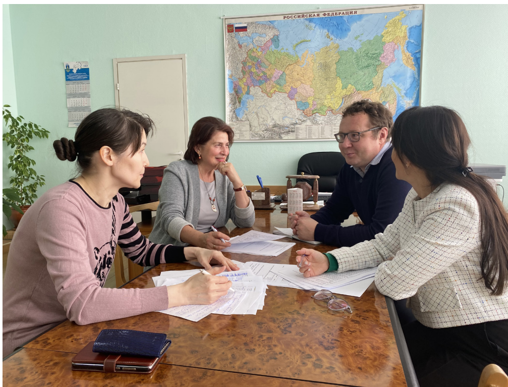
Рис. 1. Работа научного коллектива.

РАН (ИСЭИ УФИЦ РАН), кандидатом социологических наук, и Э.И. Ахметовой, научным сотрудником ИСЭИ УФИЦ РАН (рис. 1).