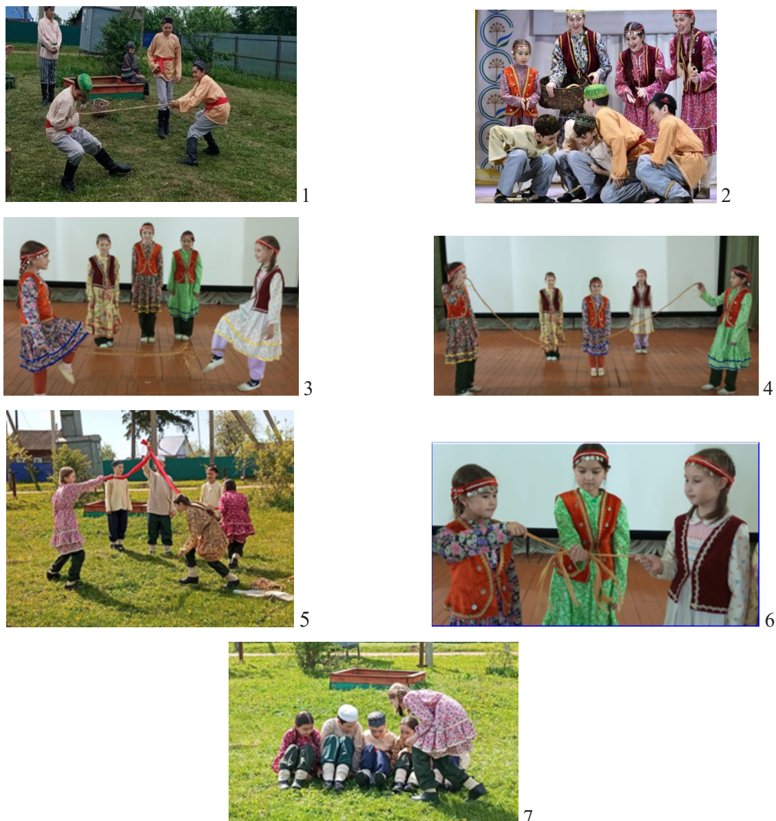
Рис. 3. Башкирские детские игры с плетеной веревкой из лыка с. Сарт-Лобово Иглинского района Республики Башкортостан.

1 – Игра “Кем алда өлгөрә?” (Кто успеет опередить?); 2 – Игра “Алыш” (Схватка); 3 – Игра “Кем көслөрәк” (Кто сильнее?); 4 – Игра “Йүкәбау аша һикереү” (Прыгаем через плетеную веревку); 5 – Игра “Сәс үреү” (Заплетаем волосы); 6 – Игра “Йүкәмеш” (Юкамеш); 7 – Игра “Шылдыр китте” (Звяк ушел)