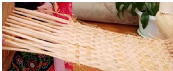
Рис. 2. Тканая лента из лыка