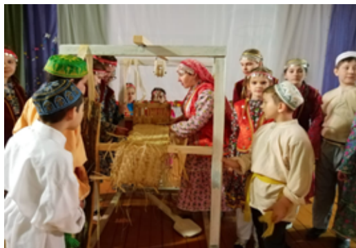
Рис. 1. Ткацкий станок

населенных пунктах на картофель, чай, сахар [Хасанова, 2017: 180]. В 1920-х гг. в Башкирии активно поддерживались кустарные промыслы. Иглинский район, богатый липовыми лесами, стал центром рогожно-кулеткацкого промысла. В с. Сарт-Лобово Иглинского района БАССР была образована артель, где на ткацких станках (рис. 1) ткали ленту шириной 50 см, длиной 100 м. Из них шили кули, которые служили для транспортировки зерна и другой продукции. Такая тара не пропускала влагу, предохраняла упакованный товар от излишнего высыхания. Тканые ленты из лыка (рис. 2) также сдавали в УМПО г. Уфы. Длинные плетеные веревки из лыка нужны были для обертывания деталей на заводе и для других нужд [Там же: 64]. Люди зарабатывали таким образом до 1980-х гг.